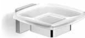
S-line tvåkopp i krom och frostat glas